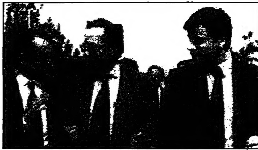
اسماعيل كاداريه (وسط) لدى عونه الى ابنايا بعد سقوط البعثية في 1992